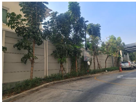
รูปที่ 1-2 ภาพพื้นที่โครงการโรงพยาบาลสินแพทย์ ลำลูกกา