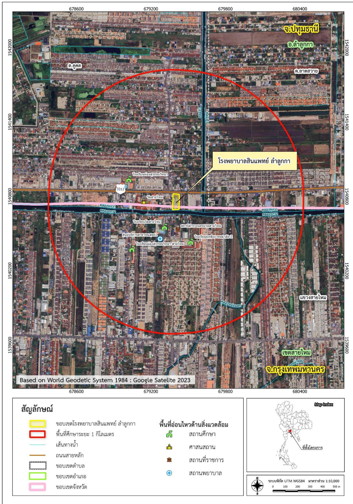
รูปที่ 1-1 ที่ตั้งโครงการ